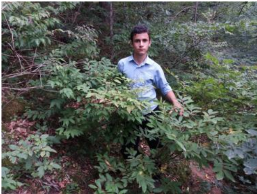
شکل ۱- بوته سیاه گیله