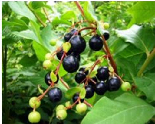
شکل ۲- میوه سیاه گیله