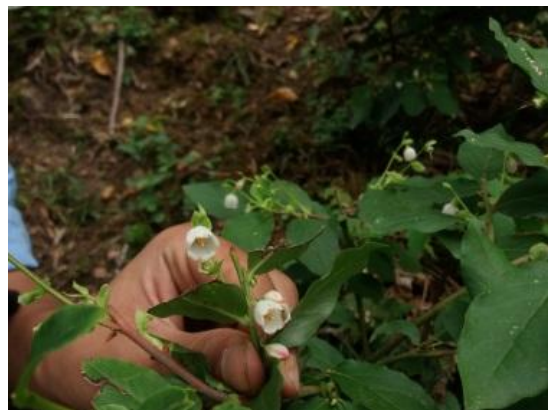
شکل ۳- گل سیاه گیله

شده و استکانی شکل، سفید مایل به سبز یا صورتی و ارغوانی خیلی روشن به طول ۳-۸ میلی‌متر آویخته بوده و دارای دمگل کوتاه، با کاسه‌ای کامل یا دارای ۴ تا ۵ لبه کوتاه، با ۸ تا ۱۰ پرچم که در خلال ماه‌های فروردین تا خرداد غنچه باز می‌کنند (شکل ۳).